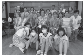
寺庭ボランティア