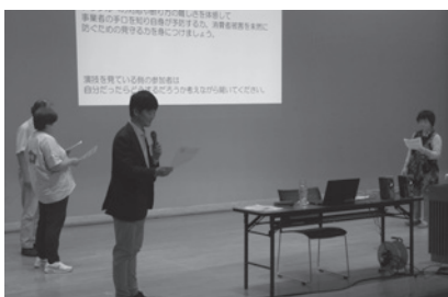
だます側、だまされる側を体験

富浦地区の民生委員児童委員、老人クラブからも参加いただき地域が連携して消費者被害の防止について学ぶことができました。