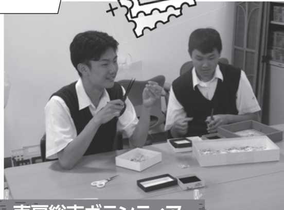
南房総市ボランティア連絡協議会 千倉支部