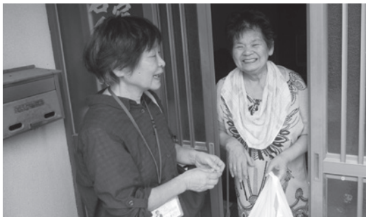
毎回楽しみにしています

地域全体で「顔の見える関係」を育み、困ったときにすぐに助けあえることを目的に、年間2回の友愛訪問を行っています。訪問には、地区社協委員をはじめ、民生委員児童委員やボランティア連絡協議会の会員などみんなで協力をしながら180世帯に、日用品や食品などを持ってうかがいます。何気ない会話の中で「夏は暑くて外に出かけられなかったよ」と聞くと、友愛訪問が顔と顔を合わせる機会となり、楽しみにつながっていると感じます。こうした日々の小さな気付きが大きな安心につながる活動だと実感します。 今後も身近で活動している福祉団体として、地域に寄り添い、お互いに楽しみを持ち、安心して暮らしていける地域を作っていくための活動を続けていきたいです。