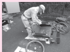
福祉機器のリサイクル