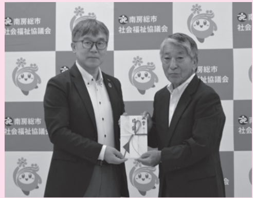
大可総支社長(左)から目録を受け取る岩波会長(右)