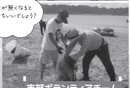
市部ボランティアチーム