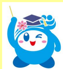
南房総市社協マスコットキャラクター“みなみん”