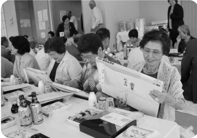
お揃いの写真 記念になるわ

昭和33年9月1日から昭和34年8月31日の間に結婚され、ご夫婦ともに健在で南房総市に居住されている方。