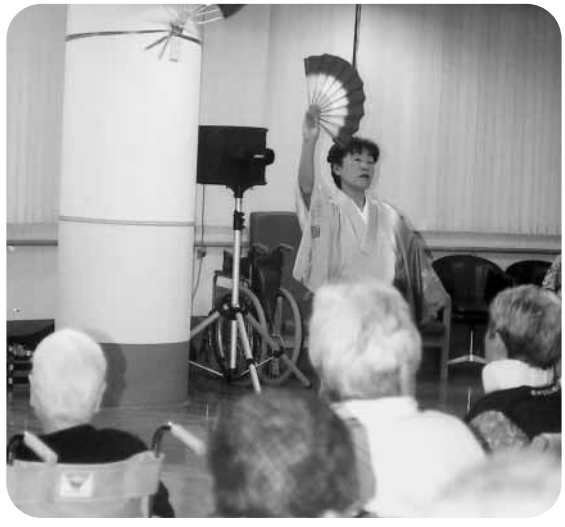
夏祭りを盛りたててくれました

8月30日「晴耕苑」で恒例の夏祭りが盛大に催され、入所者、利用者が多数の人達が地元有志の踊りなどで夏の夕べの一時を楽しく過ごしました。