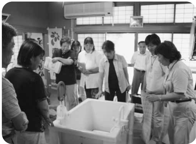
なるほど— さっそくやってみよう

在宅で介護者を抱える方を応援する、「介護者のつどい」が、三芳公民館を会場に市内より13名が集まりました。