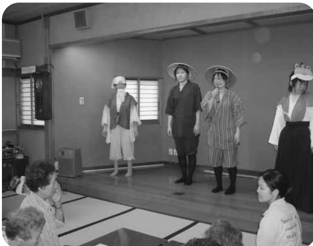
初々しい黄門様ご一行だね

地域医療活動の勉強の一つとして今年も医大生がデイサービスとみやま・お達者クラブを訪ねてくれ、毎年恒例となった医大生の企画による健康教室が開催されました。