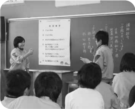
手話で自己紹介にチャレンジ