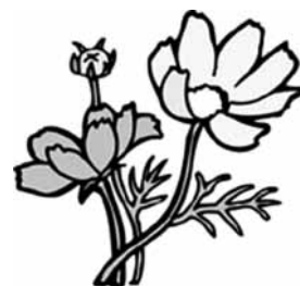
コスモス はなことば：愛情

千倉地区高齢者ふれあいの日（千倉地区社会福祉協議会主催）では、健田小6年生が参加し、高齢者と1日ふれあいました。安房人形浄瑠璃保存会館山座による上演の前に、児童が浄瑠璃を体験し、人形を操る真剣なまなざしをパチリ。