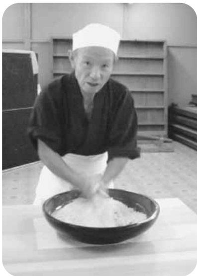
そば打ち名人登場!