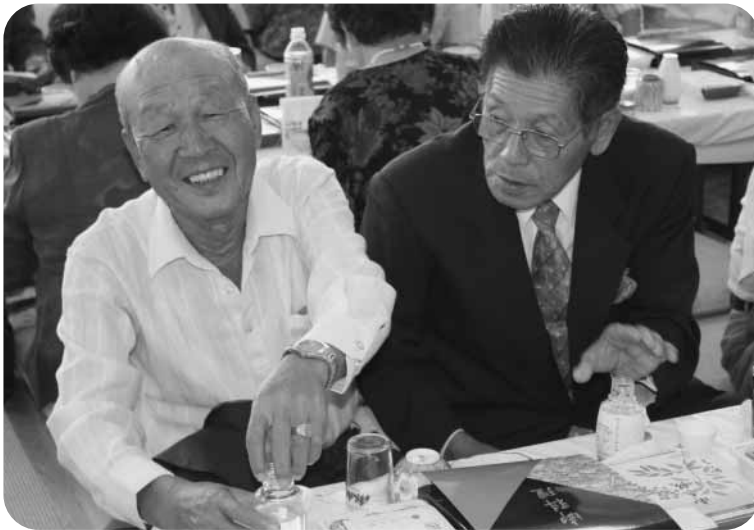
50周年のお酒は格別だなあ!!