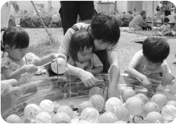
あー！ あとちょっと！

また、昔の遊びコーナーでは、高齢者によるハーモニカ演奏や剣玉の披露、そしてお手玉やシャボン玉を